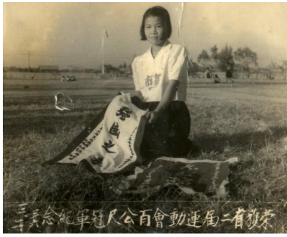
第二屆省運會百公尺冠軍留念