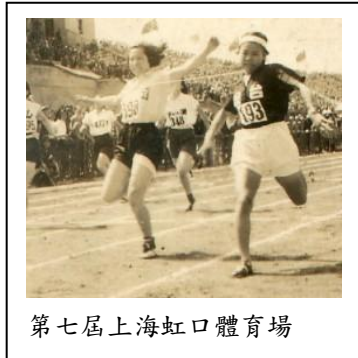
第七屆上海虹口體育場

答：記憶比較深的是全國運動會去上海參加比賽，那應是民國三十七年的事，但正確的日期我忘了，要查一下。