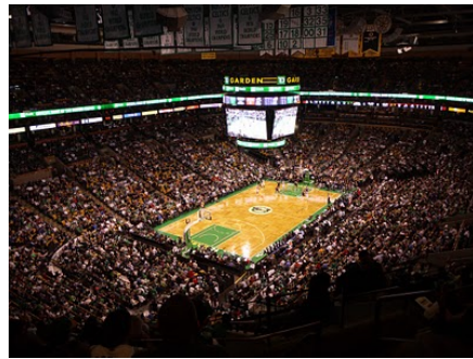
圖 4 觀賽的球迷

NBA 是一個商業聯盟，老闆們投資球隊就是為了賺錢，而聯盟組織的存在就是為了維持勞資雙方的平衡，以及幫助老闆們獲得最大的利益。 72 在有限的市場裡，球員願意接受聯盟限制經濟自由的條件，但對於最低薪資的保障、允許球員簽署對自己有利利益的合約等條件仍積極與聯盟協商。 73 若封館一整季，勞資雙方的損失都是以億萬美元計算，更重要的損失是金錢無法衡量的就是：球迷， 74 球團的收入利益與球員支持度必須仰賴於廣大球迷的興趣與支持。 75