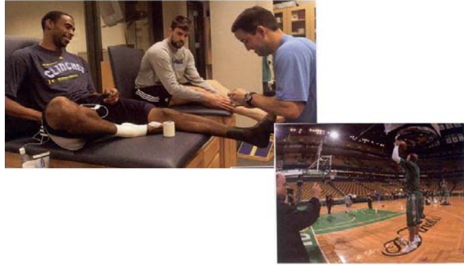
圖 3 封館期間，球員無法使用球隊各項資源，包括運動防護及球館。