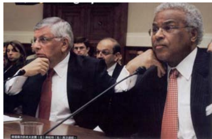
圖 1 談判代表資方史騰 (David Stern) (左) 與勞方杭特 (Billy Hunter) (右)

擁有球隊的球團老闆屬於資產階級，球員則是受雇於球團的無產階級，階級對立是造成衝突的首要因素。由於經濟大環境影響，為了彌補球團營運的虧損，資方的立場認為唯有調降球員的薪資才能為球團帶來盈利。 28 如此典型的資方行為，是勞方最抗拒的部份。 29