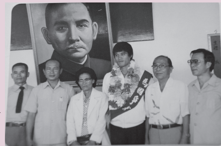
圖4 古金水的成就，族人們引以為傲