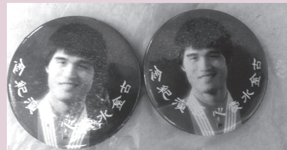
圖3 古金水舉辦愛心慈善晚會時，以紀念章代替門票