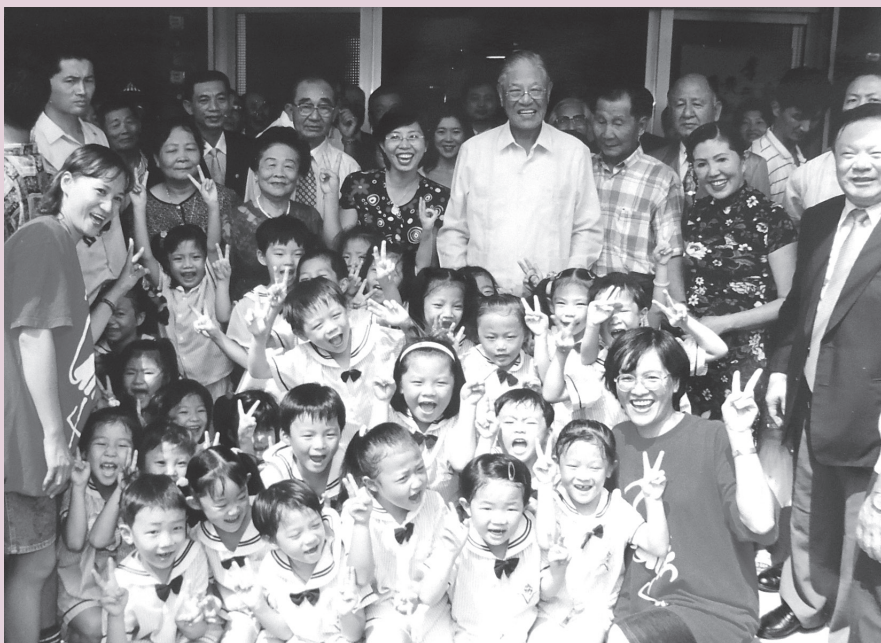
圖12 1999年9月前總統李登輝在蘇正生住家前和東山成功幼稚園小朋友合影

這大概是東山鄉設鄉以來最重要的一位在朝官員來訪，中興路上二步一崗、五步一哨，縣長、鄉長也都來了，還有蘇正生的親人、朋友，將中興路擠得熱鬧滾滾。原來喜歡體育運動、留學京都的李登輝本來就知道嘉農和蘇正生，但是有一天聽到副秘書長黃正雄提起蘇正生是他同學楊營昌的老丈人時，便說：「你幫我安排一下，我要去看他……」