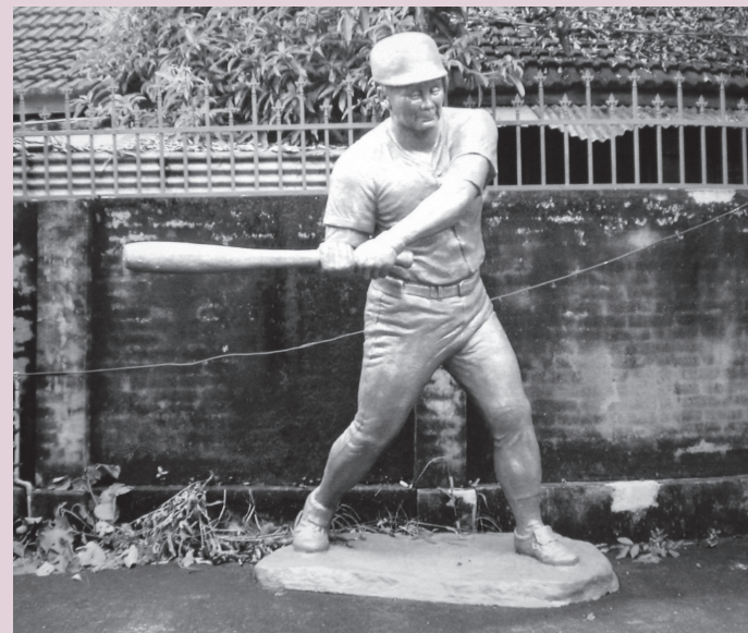
圖13 陳設在嘉義大學（前嘉農球場）的蘇正生銅像

國內多位棒球作家感佩蘇正生及嘉農棒球精神，撰寫了多本專書，引發電影製片魏德盛及導演們矚目，籌拍《KANO》電影，可惜在電影殺青時，蘇正生先生已在2008年年底先走一步了……。