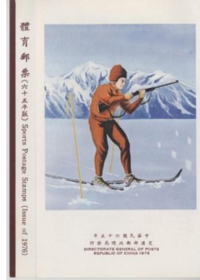
圖 5 1972 年冬季奧運會貼票卡封底 圖 6 1976 年冬季奧運會護票卡封面