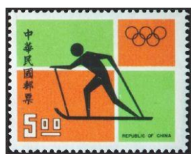
圖 12 越野滑雪