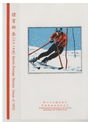
圖 3 1972 年冬季奧運會貼票卡封

此兩套體育郵票發行時，中華郵政亦發售貼票卡與護票卡。自 1960 年起，每套新郵票的發行，皆發售貼票卡，另外，從 1972 年開始亦發行有透明護郵膠膜的貼票卡片，稱之為護票卡。1972 年所發行之貼票卡及 1976 年發行的護票卡，其封面的部分，分別以滑雪及滑雪射擊之動作為圖案，內頁除說明外，亦貼有發行郵票，封底的部分，印有此套郵票發行的日期、套號、面值、數量、用紙、印刷等等郵票資訊，其發售式樣詳見下圖 3 至圖 8。