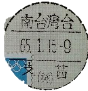
圖 9 1972 年冬季奧運會首日郵戳 圖 10 1976 年冬季奧運會首日郵戳