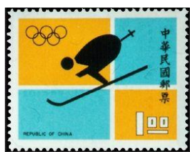
圖 11 滑降

1972年臺灣首次以冬季運動項目為主題發行郵票，是為紀念臺灣首度參加第11屆日本札幌冬季奧運會，臺灣於1968年始成為國際滑雪總會會員，此屆應邀參加冬季奧運會，其意義重大，故發行此套郵票，以示紀念，其郵票圖樣如下圖11至13。此套郵票於1972年2月3日札幌冬季奧運會開幕當日發行，主要圖案之設計係以此屆奧運會之圖案標誌為藍本進行繪製（如圖14），圖案之選取以滑降、越野滑雪以及大迴轉此三項運動項目為主，並在郵票上方印有奧林匹克五環之標誌，分別以一元、五元及八元之面額發行，各張郵票發行量分別為三百萬、兩百萬及一百萬張。