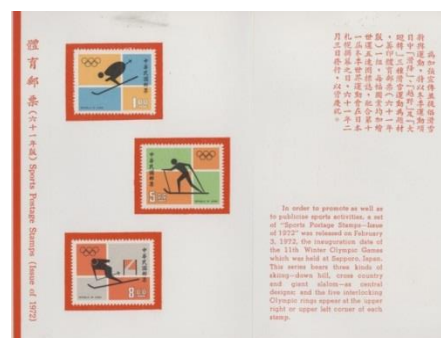
圖 4 1972 年冬季奧運會貼票卡內頁