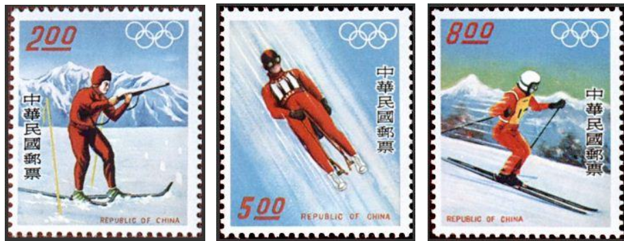
圖 15 冬季兩項 (Biathlon) 圖 16 雪橇 (Luge) 圖 17 滑雪 (Skiing)

1976 年為臺灣第二次參加冬季奧運會，此次賽事由奧地利茵斯布魯克舉辦第 12 屆冬季奧運會，發行之郵票圖樣如下圖 15 至 17。此套郵票於 1976 年 1 月 15 日發行，為提倡並加強宣傳冬季運動項目，其圖係以臺灣參賽的冬季兩項中的滑雪射擊、雪橇以及滑雪此三項為主，並在郵票上方印有奧林匹克五環之標誌，分別以兩元、五元及八元之面額發行，各張郵票發行量分別為五百萬、兩百二十萬及一百八十萬張。