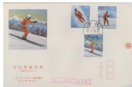
圖 2 1976 年冬季奧運會套票封