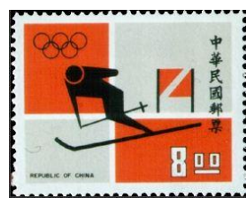
圖 13 大迴轉