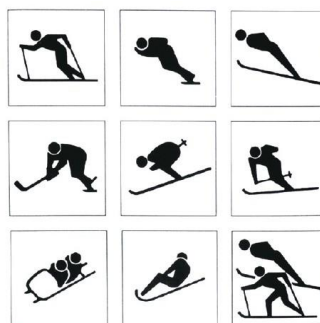
圖 14 1972年日本札幌第11屆冬季奧運會運動圖標設計