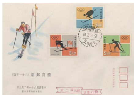
圖 1 1972 年冬季奧運會首日封