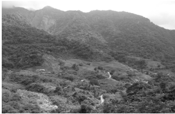
圖二 黑暗部落內無任何電線桿