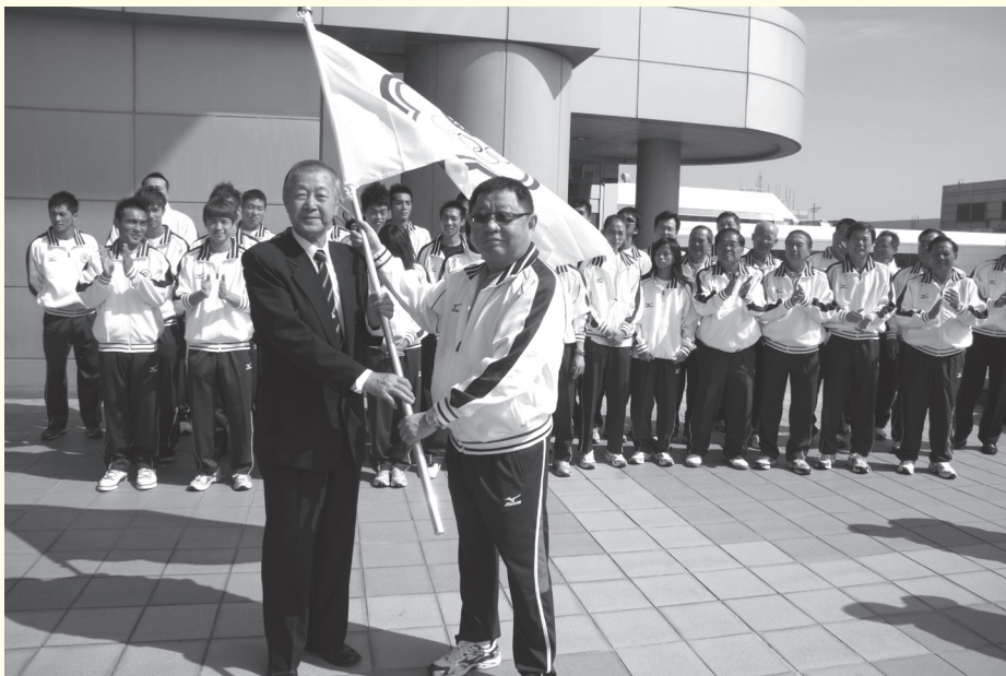
圖4 2009年第十八屆亞洲田徑錦標賽授旗。

「那時候請辭田協理事長是因為有一些風波，也不是只有我一個，說沽名釣譽什麼，那就想乾脆不要做。一個協會能有多少錢？你看一些企業家事業做多大，誰會去A那種東西？你要改革，可以針對有問題的協會去改革，我跟田徑有什麼關係？那時候是真的找不到人要接。」（註25）