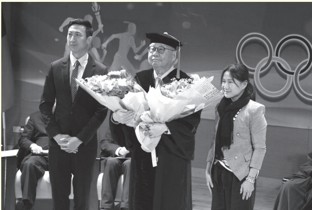
圖7 與奧運國手朱木炎、陳葦綾合照。