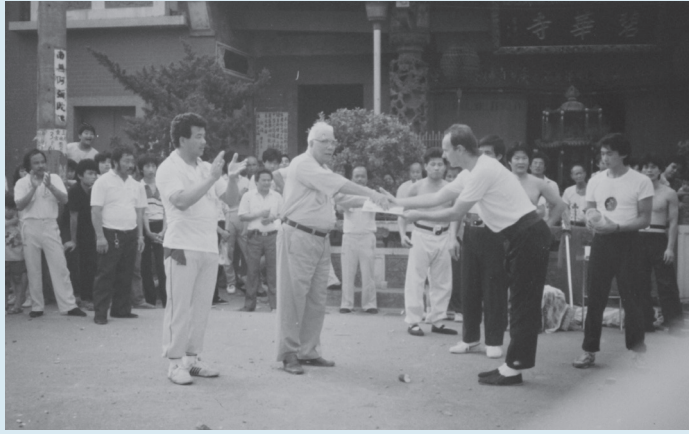
◀ 圖14 1986年，蘇磨頒發證書給南非弟子