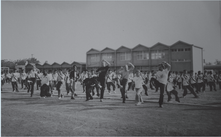
圖13 南非學生與飛沙國中學生一同習武練拳

雲林縣政府教育局針對全縣187所國中小學調查後，選擇國術、跆拳道、太極拳、有氧拳擊、武術等五項，作為雲林縣學生武術項目的推廣與普及化。（註108）2003（民國92）年起，雲林縣國術委員會配合縣政府的政策，每年於4至5月間舉辦春季縣長盃國術錦標賽；9至10月間舉辦秋季縣長盃國術錦標賽，選手分為國小組、國中組及高中組；競賽項目亦逐年增加，包括競賽套路（南拳、長拳、太極拳）、傳統北拳、傳統南拳、內家拳、長兵、短兵、雜兵及器械對練等項目。（註109）每次競賽，四湖鄉轄內的學校所派出去的競賽選手，在武術場上均得到優異成績，其中，不乏選手更被視為後起之秀，顯示出四湖鄉已成為雲林縣推展武術運動的推手，亦是生產國術好手的搖籃，（註110）此乃歸功於雲林縣政府、雲林縣國術委員會、四湖鄉的全力